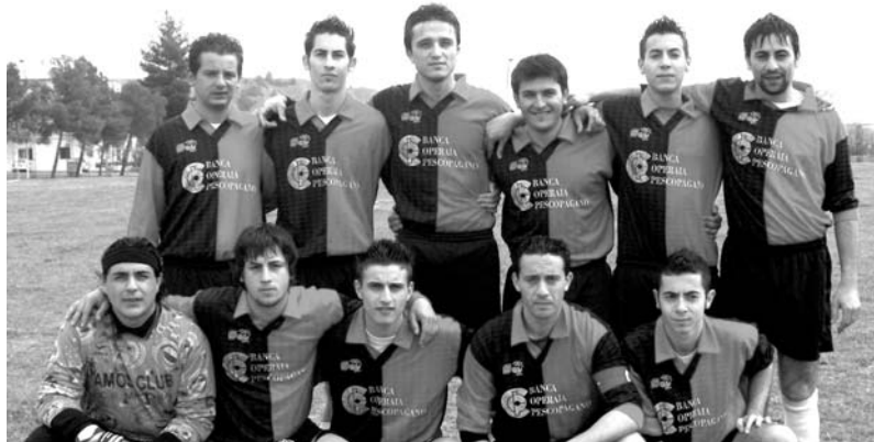
La formazione del Craco. Nella prossima stagione militerà in seconda categoria